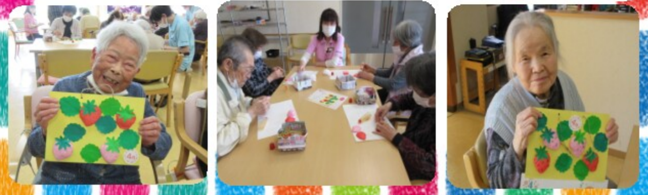
イチゴをティッシュでふんわりと作るのに苦戦しました。